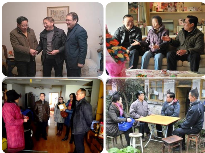
2015 年 2 月 9 日至 15 日，开展春节送温暖活动。