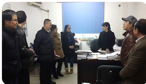
科研支部检查管理、支撑支部

经过对以上各项内容的量化考评，8 支在职党支部中有 6 支党支部的检查结果为优秀，2 支为合格。通过交叉检查，达到了交流经验、互相学习、促进工作、规范管理的目的，为加强成都生物所党组织建设奠定了良好的基础。