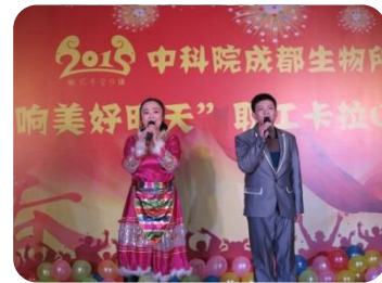
职能一支部演唱《贝加尔湖畔》 获得比赛一等奖

经过近两个小时紧张激烈的角逐，职能一支部演唱的《贝加尔湖畔》以真挚的情感和演员默契的配合获得了本次比赛一等奖，农业中心支部、两爬支部获得了比赛二等奖，职能二支部、支撑支部获得了比赛三等奖。