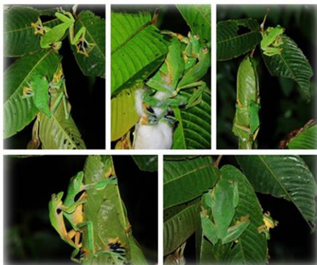
一等奖：黑蹼树蛙繁殖

由中科院成都生物所团委与中科院成都生物所两栖爬行动物标本馆联合主办，两栖爬行动物保护协会承办的“第二届两栖爬行动物摄影大赛”圆满落下帷幕。