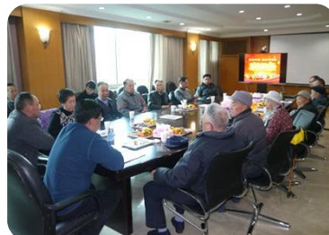
2 月 13 日, 召开离退休干部新春茶话会。