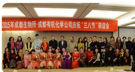
成都生物所和成都有机化学 公司集体合影

2015 年 3 月 6 日，为迎接一年一度的“三八”劳动妇女节，成都生物所、成都有机化学公司共同举行了庆祝“三八妇女节”联谊会。双方领导及女同胞们表演了精彩的节目。通过此次联谊活动，进一步增进了成都生物所与成都有机化学公司的友谊。