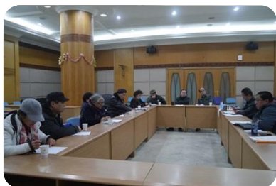
1 月 23 日, 召开退休职工党支部书记座谈会。